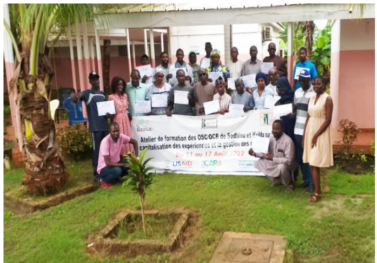
Figure 2 : Session de formation des acteurs d'OSC/OCB de la région de Sédhiou

Le choix des organisations à former a été fait suivant plusieurs critères. La formation était destinée aux acteurs de la société civile, organisations communautaires de base ou Organisations non gouvernementales qui interviennent dans le domaine de la santé et ayant un fort impact en termes de représentativité et d'interventions dans les régions d'intervention. Au total, 102 (60 hommes, 42 femmes) responsables d'OSC/OCB ont été formés, et la majorité d'entre eux intervient dans le domaine de la santé maternelle et infantile.